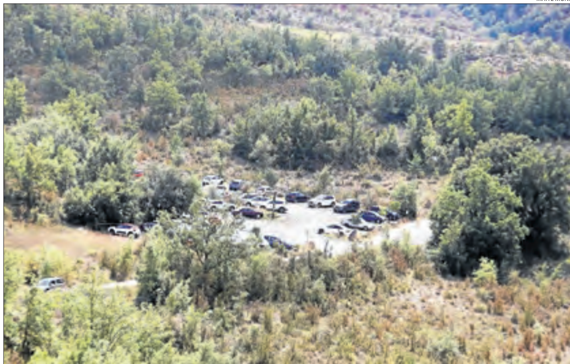
Prop d'un centenar de vehicles van estacionar ahir al pàrquing gestionat per la Fundació La Pedrera.