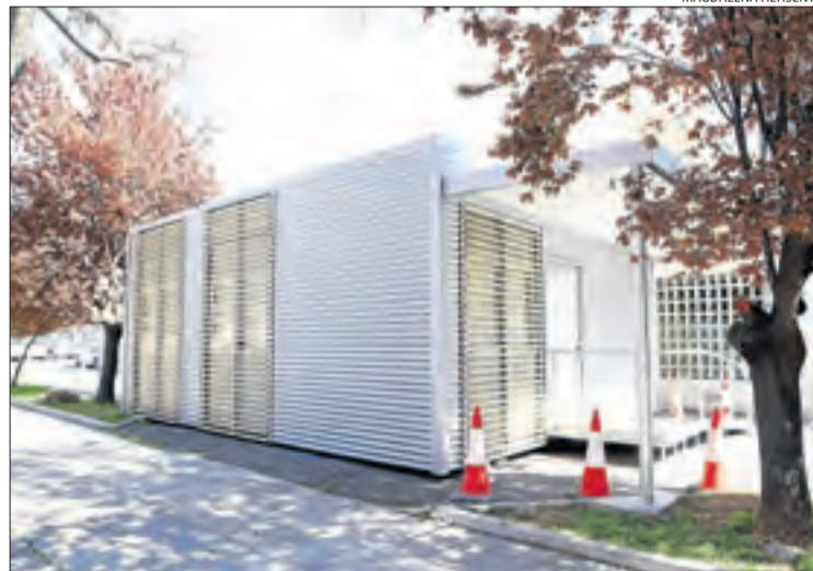
El mòdul ubicat al costat del CAP de Balàfia-Pardinyes.

Al Pirineu, la disminució més notable es troba al CAP de la Seu d'Urgell, d'un 73,3%, ja que ha atès només quatre positius en l'última setmana davant els 15 de l'anterior. Així mateix, descendeixen un 50% els casos a les àrees de Salut del Pallars Sobirà (de 4 a 2) i de Tremp (de 2 a 1). En canvi, s'incrementen a la Pobla de Segur d'1 a 4 i a Aran, d'1 a 2. A l'Alta Ribagorça