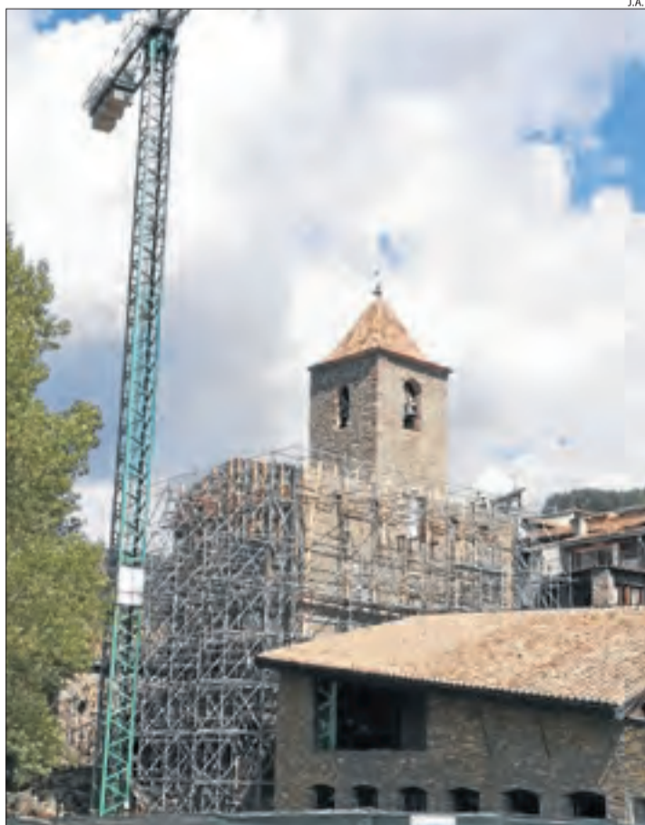
La gran bastida perimetral per assegurar l'edifici de l'Arxiu.

Les obres es van adjudicar el mes d'abril per uns 900.000 euros i estan a càrrec de la Generalitat amb la previsió de posar-lo en marxa el setembre del 2022. Juntament amb l'arxiu de les Garrigues, a les Borges Blanques, completarà la xarxa d'arxius comarcals de Catalunya.