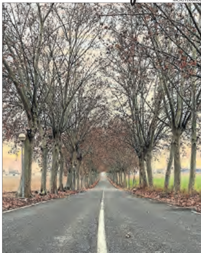
L'entorn destaca per les terres de regadiu i àrees forestals.

Gimenells i el Pla de la Font disposen d'una vida social activa i enèrgica, d'un caràcter emprendedor i audaç, i d'un teixit econòmic divers, agrícola, ramader, turístic i de serveis. Teixit que exigeix, més que