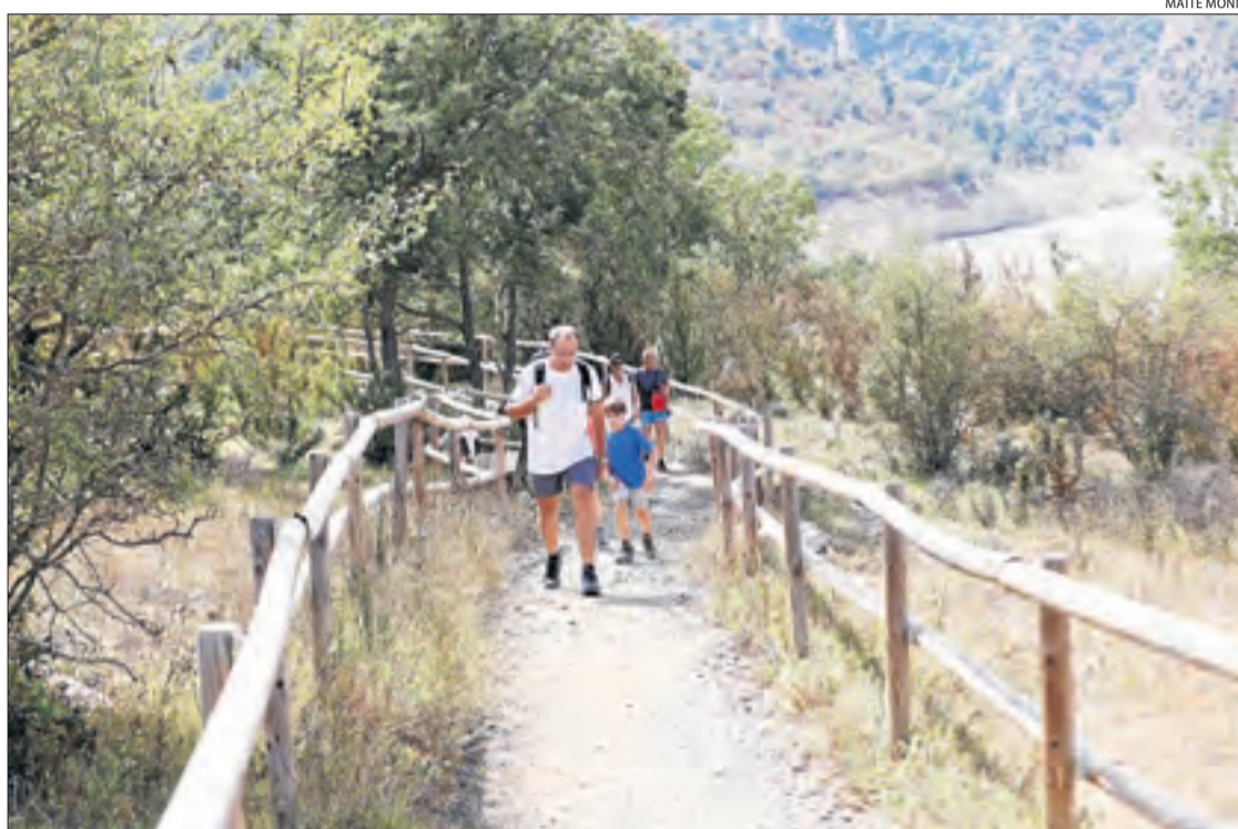
Senderistes inicien el recorregut de Mont-rebei des del pàrquing de la Masieta.