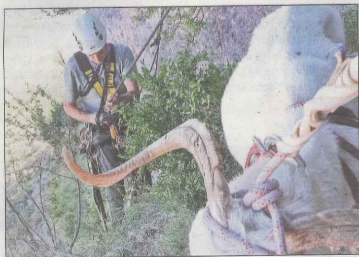
Va quedar enrocada per culpa d'un gos deslligat

Baqueira Beret ja està preparada per iniciar una nova temporada de neu i d'esquí. Els visitants tindran nous i renovats remuntadors. Aquest hivern, esquiadors i snowboarders gaudiran d'un nou telecadira: Clòt der Os, un desembragable de sis places que no només arriba per a redibuixar la zona de debutants de Beret si no també per a millorar la connexió amb el telecadira de Dossau.