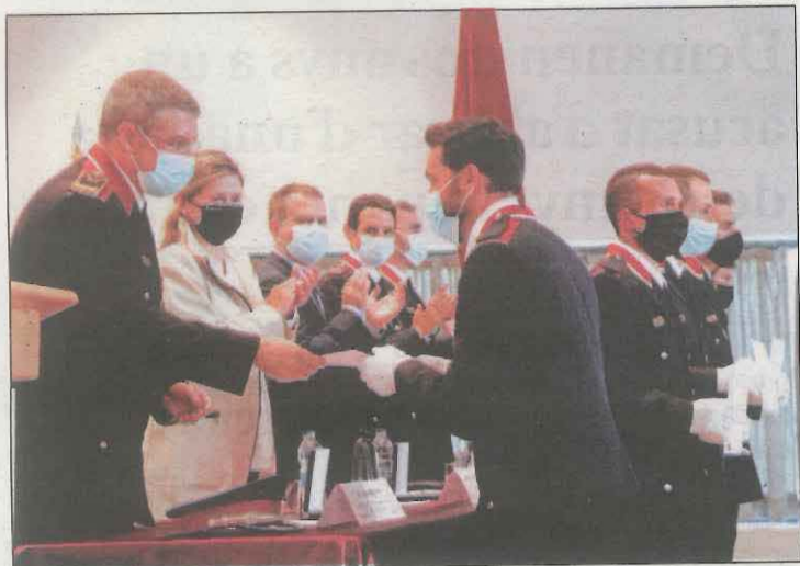
Es van entregar cinc condecoracions i 97 felicitacions