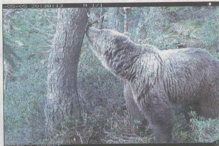
Imatge d'un os adult en un hàbitat natural

La competència que assumirà el Consell General inclou l'execució de les actuacions de gestió dels grans carnívors, mitjançant