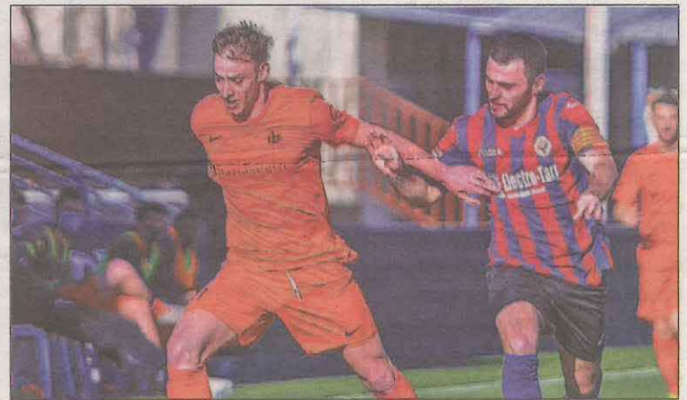
Un partido del Tàrrega, en una imagen de archivo

La UE Tàrrega se vio superada ayer en el encuentro del Grupo 3 de Primera Catalana que jugó contra el Vilanova i la Geltrú con un único tanto que marcó la diferencia.