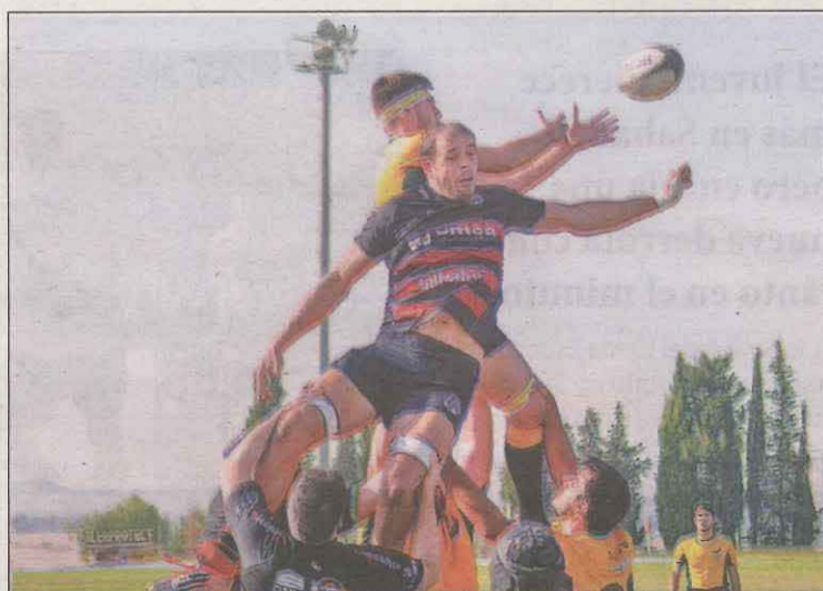
Imagen de uno de los partidos