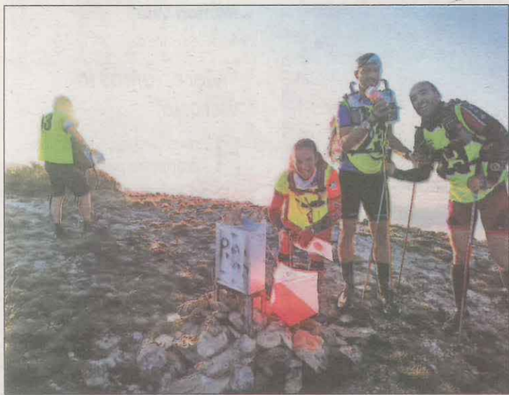
La mayoría de equipos fueron mixtos