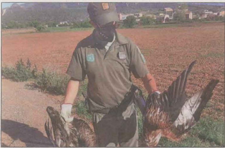
Un efectiu del cos amb les dues aus mortes electrocutades